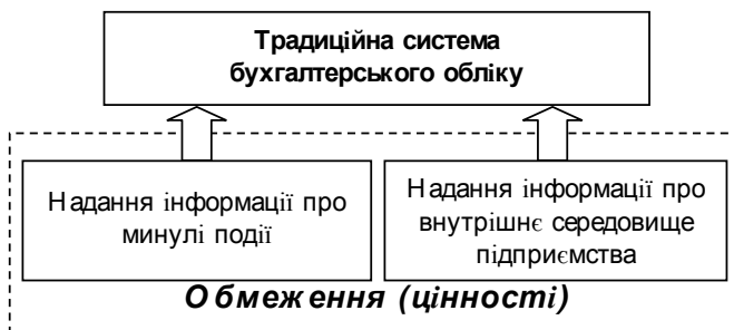
Рис. 1. Основні обмеження (цінності) традиційної системи бухгалтерського обліку

сільськогосподарськими підприємствами. З іншого боку, ці обмеження є методологічними обліковими цінностями, яких повинні дотримуватися науковці при внесенні пропозицій щодо удосконалення облікової системи (рис. 1).